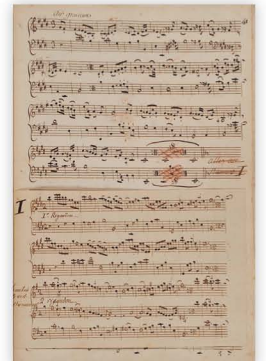
Partition originale du Devin du village, opéra écrit par Rousseau