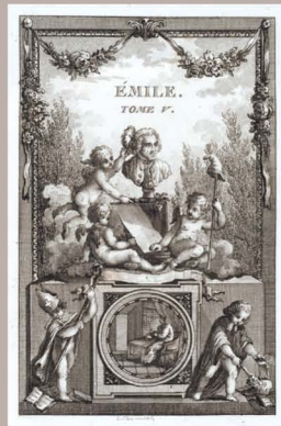
l'Émile - Œuvres complètes de J.J. Rousseau (Didot l'aîné, 1792)

Issue du fonds de l'Assemblée nationale et de prêts consentis par la Bibliothèque nationale de France, le Musée Carnavalet, l'Institut de France (Abbaye de Chaalis), le Musée Jean-Jacques Rousseau de Montmorency et la Bibliothèque de Genève, cette exposition réunit pour la première fois un ensemble exceptionnel de documents uniques qui permet de restituer toutes les dimensions du Rousseau de la Révolution.