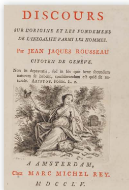
Discours sur l'origine et les fondements de l'inégalité