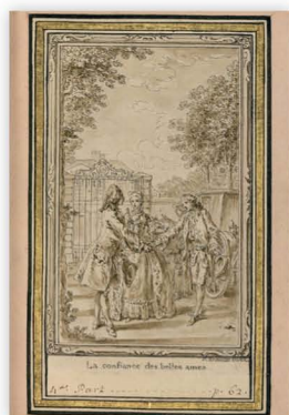
Illustration (par Gravelot) de la copie manuscrite de La Nouvelle Héloïse