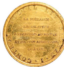
Médaille de la Convention à l'effigie de Rousseau